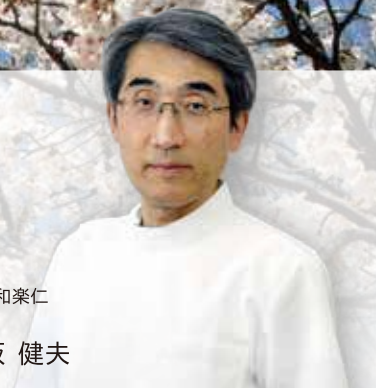
医療法人社団 和楽仁 芳珠記念病院

現在、新型コロナウイルス感染症と、それに派生する困難な問題が、早急に対応を要する課題です。何としても患者さん、利用者さん、それを取り巻く地域の皆さんに及ぶ被害を最小限に抑えるべく取り組みたいと思えます。また、今後は、少子高齢化や医療資源の偏在など、わが国