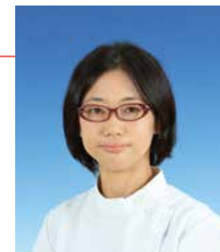
みやけ みほ 三宅 美帆