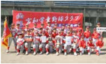
【優勝】宮和学童野球クラブ