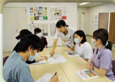
認知症患者への対応研修