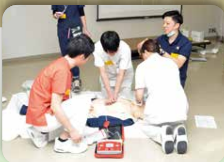
BLS(一次救命処置)講習