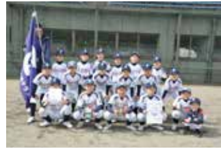
【準優勝】辰口学童野球クラブ

全8チームが参加し、3日間にわたる熱戦を繰り広げました。決勝戦では、宮和学童野球クラブが辰口学童野球クラブを抑え優勝。今大会2連覇を成し遂げました。両チームは、5月11日から開催される加賀中ブロック大会に出場します。