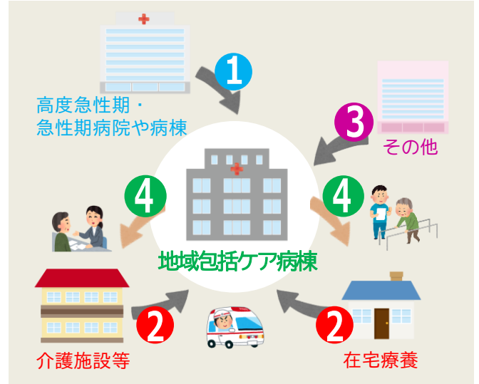
地域包括ケア病棟の4つの機能<イメージ図>